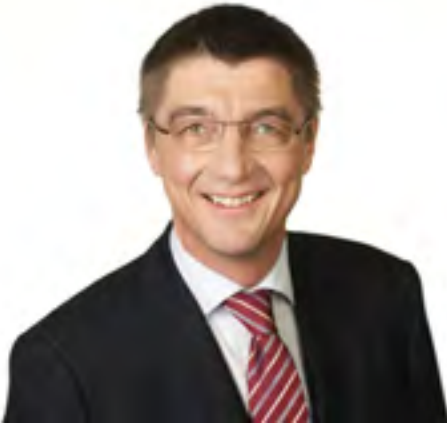
Andreas Schockenhoff Stellvertretender Vorsitzender der CDU/CSU-Bundestagsfraktion

Der Russlandbeauftragte der Bundesregierung und stellvertretende Vorsitzende der Unionsfraktion, Andreas Schockenhoff, hat in der vergangenen Woche am „Petersburger Dialog“ – einem Gesprächsforum mit Vertretern der russischen und deutschen Zivilgesellschaft – teilgenommen. Über seine Kritik an den jüngsten politischen Entwicklungen in Russland und über den Entschließungsantrag der Koalition dazu sprach „Fraktion direkt“ mit ihm.