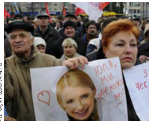
Demonstration gegen Wahlbetrug in Kiew

Parlamentswahl setzt die Reihe der Rückschritte in der demokratischen Entwicklung der Ukraine fort. So wurde seit dem Amtsantritt Janukowitschs die sich langsam entwickelnde Unabhängigkeit des Justizsystems systematisch zurückgedreht. Die Pressefreiheit wird ebenfalls zunehmend eingeschränkt.