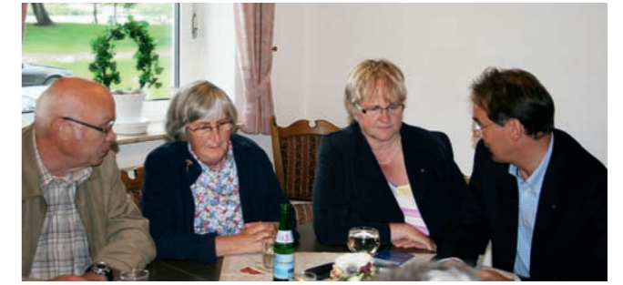
Gemütlich! // Bei diesem Wetter plaudert man lieber drinnen.

Kanutourismus stand daher für diesen Tag auf dem Programm. Nordfriesen sind ja hart im Nehmen, aber das Wetter war leider einfach zu stürmisch, um per Kanu von Fresendelf nach Schwabstedt zu paddeln.