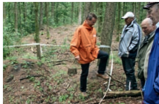
Joldelund // Besichtigung der Ausgrabungsstätte in der „Joldelunder Schweiz“. Dort befand sich in der Eisenzeit eine Siedlung, die vor einigen Jahren entdeckt wurde.