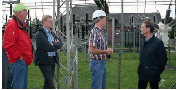
ARGE Netz // Besichtigung des Umspannwerks mit der ARGE Netz.