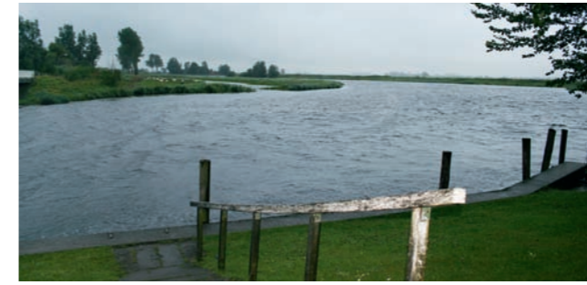
Wild! // Die Treene wird zum wilden Gewässer.