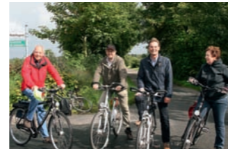
Margarethenberg // Von hier aus hat man einen fantastischen Blick bis zur Nordsee.